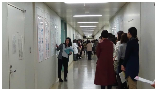
看護研究発表会の様子