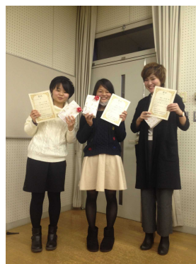
オリジナリティー賞